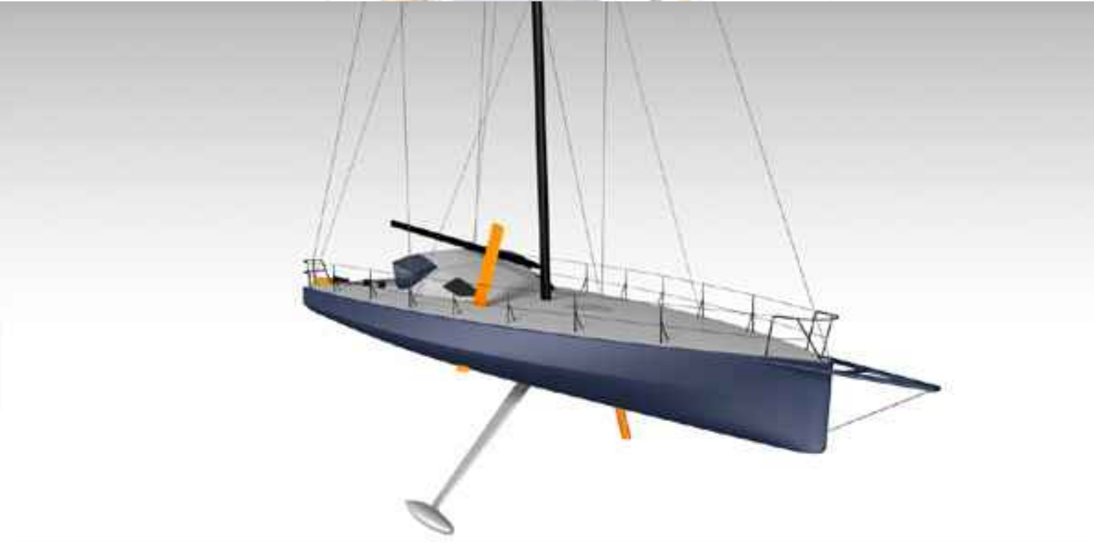
Images 3D Mer Forte réalisées avec CATIA, en collaboration avec Dassault Systèmes Mer Forte 3D image made by CATIA, in collaboration with Dassault Systèmes